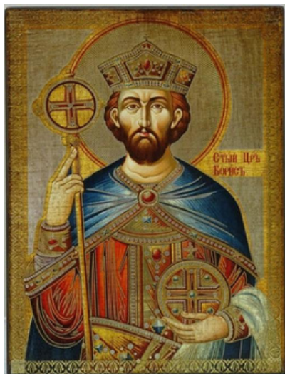
Св. цар Борис- Михаил

Чрез покръстването на народа ни обединил двете народности в тогавашна България. Успял да извоюва за нашата Църква пълна независимост в 870 г. на Цариградския поместен събор.