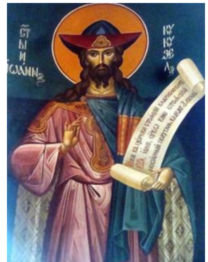
Св. Йоан Кукузел

известна в България повече като Параскева или Петка Българска (Търновска), тя е една от най-почитаните светици на Балканите не само през XIII – XIV в., но и до днес.