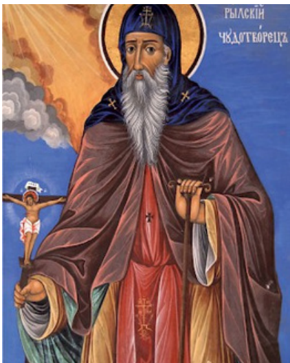
Св. Иван Рилски

най-великият светец на българския народ и негов небесен покровител. Основател на Рилския манастир. Извършил много чудеса през живота си и след смъртта си.