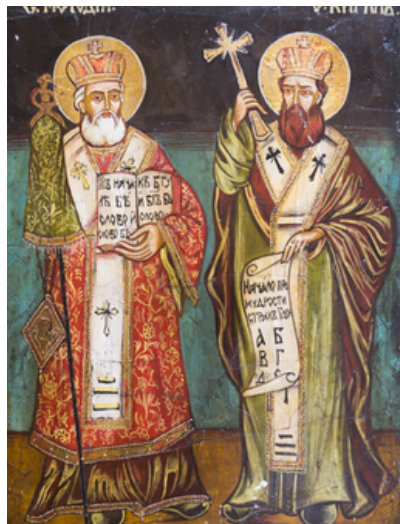
Св. братя Кирил и Методий

Чрез покръстването на народа ни обединил двете народности в тогавашна България. Успял да извоюва за нашата Църква пълна независимост в 870 г. на Цариградския поместен събор.