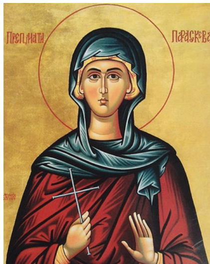
Св. Петка Търновска

най-великият светец на българския народ и негов небесен покровител. Основател на Рилския манастир. Извършил много чудеса през живота си и след смъртта си.